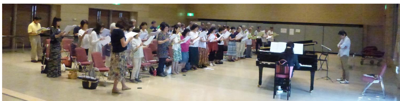
練習風景(混声合唱) 於:大府市勤労文化会館(H30 夏合宿)

職場合唱時代の仲間や、会員の家族またはその知り合いで構成されており、2005年の愛知万博公演に出演したのを契機として、2006年に第1回ファミリー合同練習会に参加。その後、熱田文化小劇場で行った第6回サロンコンサート以降、毎回出演しており、このステージを楽しみにJMCの活動を見守ってサポーター役を努めている。コンサートが近づくと結成され、会員を常に募集しています。